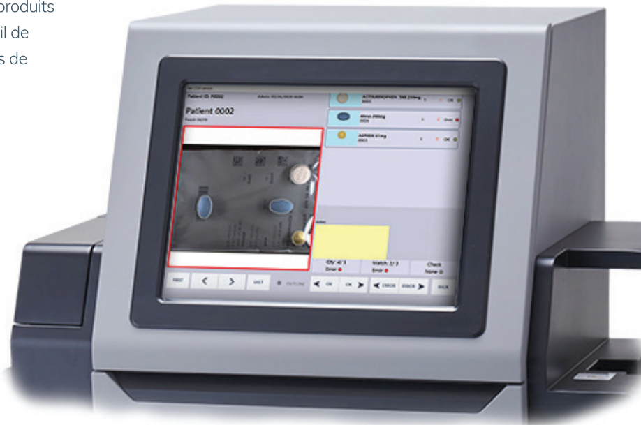
(Illustré avec un écran de révision d'erreurs potentielles.)

En plus de permettre à la pharmacie d'attester de la conformité du contenu de l'emballage et du moment de son emballage, le système FastPak Verify autorise un accès facile à des données statistiques, vous procurant ainsi des renseignements historiques des inspections effectuées pour que vous puissiez revoir les erreurs et identifier les tendances.